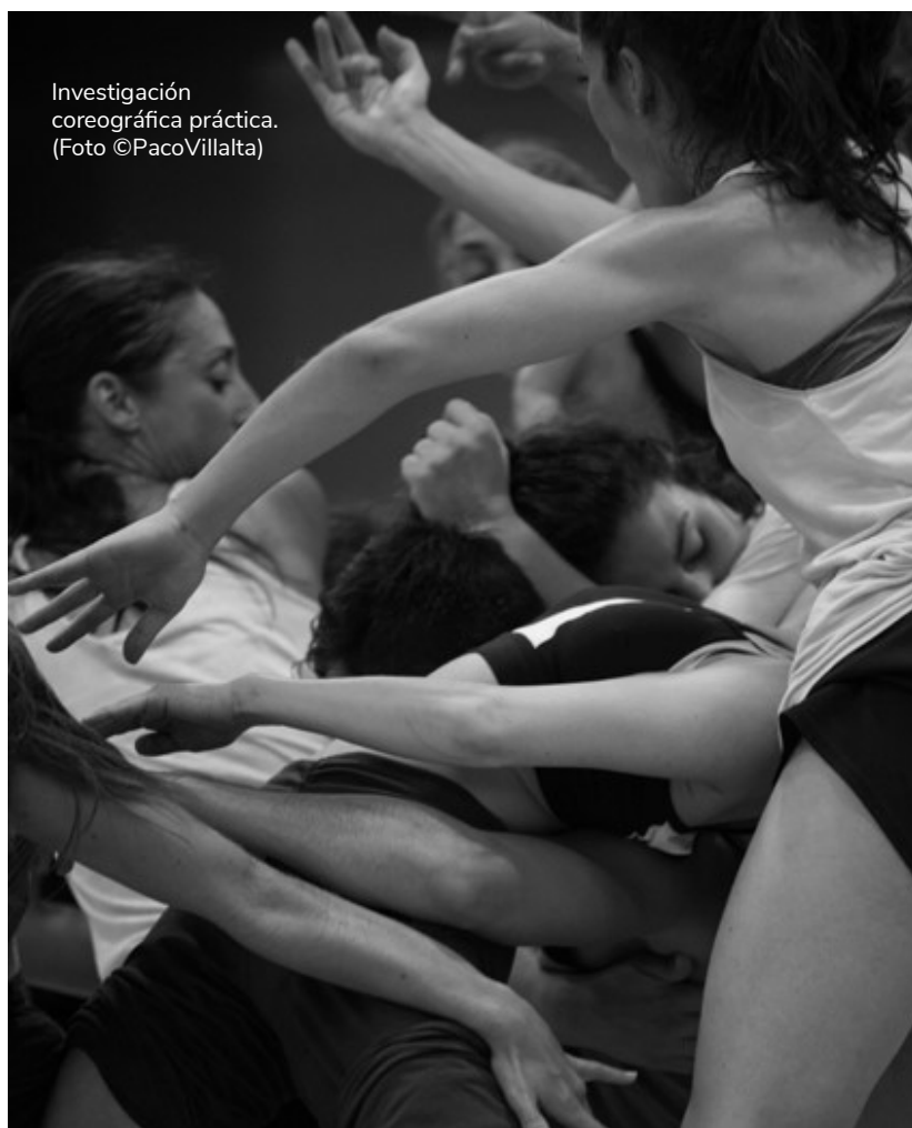
Investigación coreográfica práctica.

En estos diez años ha habido tiempo a formularse y reformularse abriendo actividades más o menos puntuales o satélites, que retroalimentan indiscutiblemente el propio núcleo de EC: Muestras de Resultados/Invasiones en Espacios no Convencionales, Congresos, Mesas de Trabajo, Coloquios, Charlas, Talleres, Exposiciones, Presentaciones, Encuentros con el Público, Ruedas