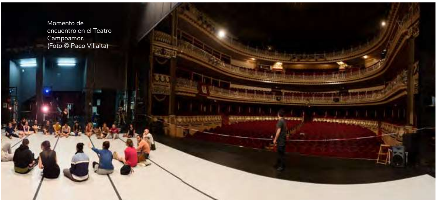
Momento de encuentro en el Teatro Campoamor.

A lo largo de este tiempo EC se ha proyectado como una plataforma de encuentro ecléctico y dinamizador con el empeño de generar un diálogo horizontal y transversal desde diferentes fuentes de reflexión y conocimiento. Un aprovechamiento investigador y artístico que nutre a cada miembro del equipo intentando abrir nuevos caminos de pensamiento y práctica o habitar desde renovados posicionamientos aquellos caminos reconocidos o reconocibles. Un espacio abierto a nuevas y flexibles vertebaciones generando en cada edición valiosas correlaciones que proponen en ese mismo momento o, a posteriori, otros proyectos o encuentros.